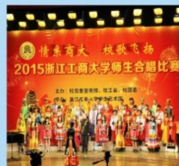
经济学子活跃在校运动会赛场