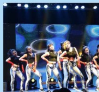
经济学院迎新晚会现场