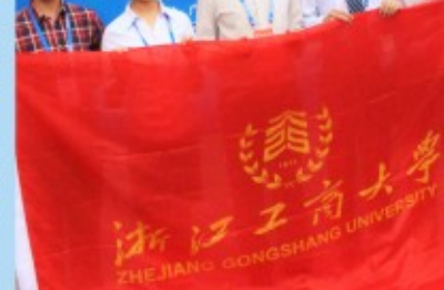
经济学院学生团队参加第十四届“挑战杯”获得二等奖