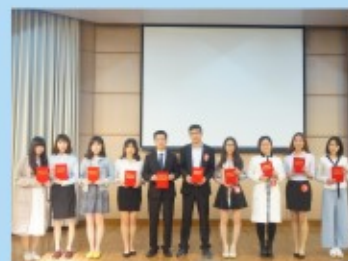
经济学院十佳经济学子颁奖典礼