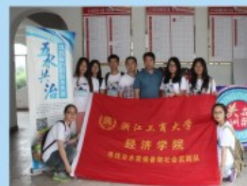
经济学子活跃在校运动会赛场