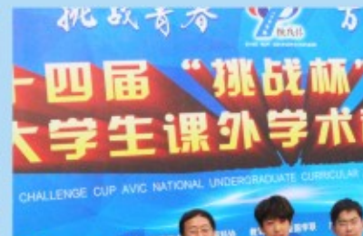
经济学院学生团队参加第十四届“挑战杯”获得二等奖