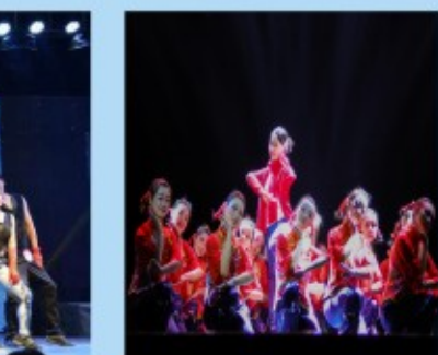
经济学院迎新晚会现场