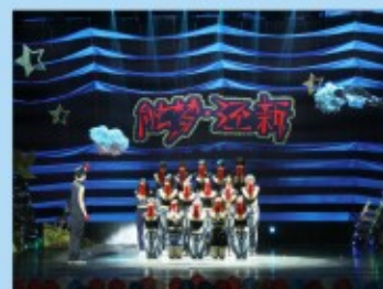
经济学院迎新晚会现场